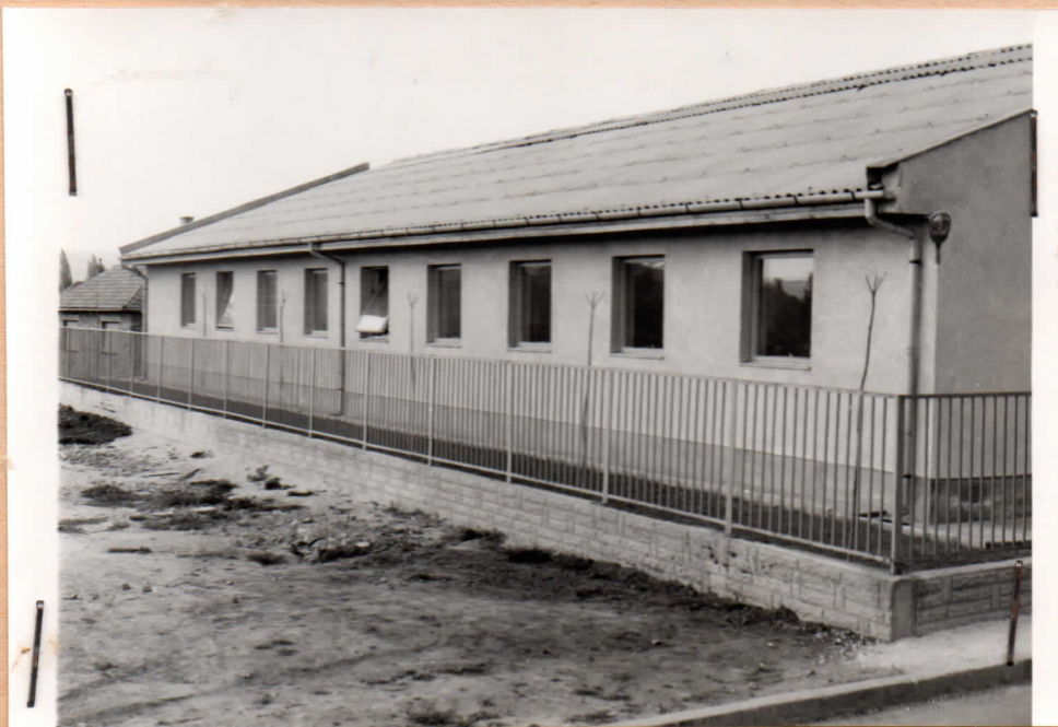
A Ferroglobus üzemcsarnoka