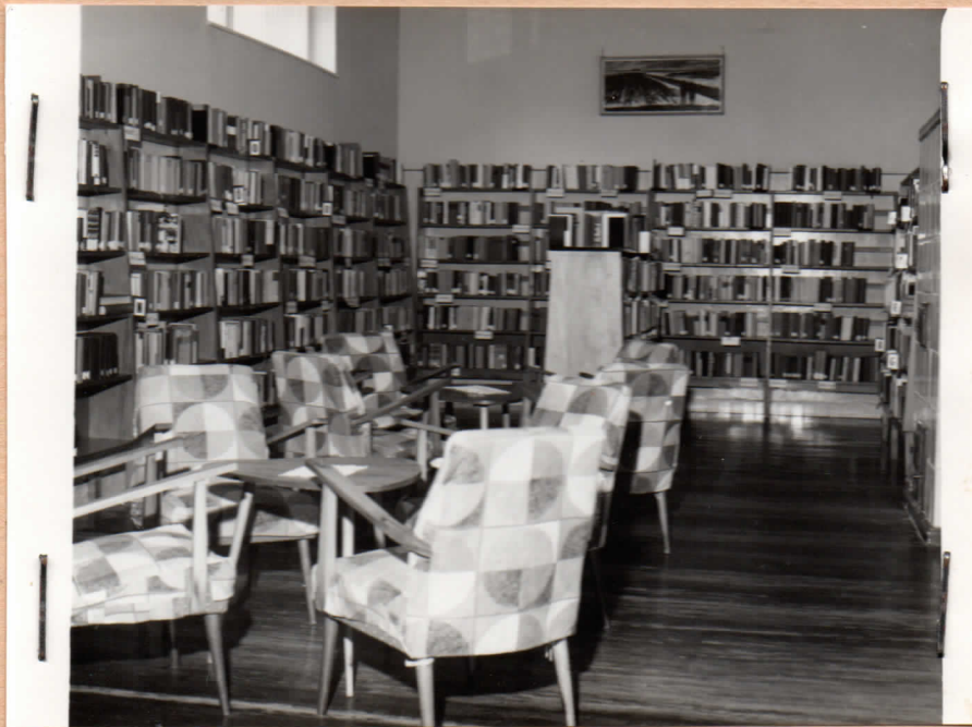
Községi Könyvtár olvasóterme